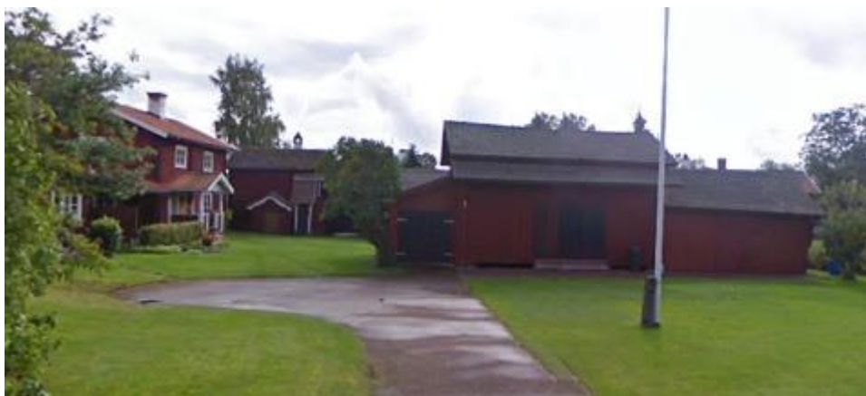
Vy från Siljegårdsvägen på 2000-talet. Troligtvis är uthuset med källarstuga direkt t.h. om bostadshuset samma som 1825, möjligen även bostadshuset (se kartor nedan).