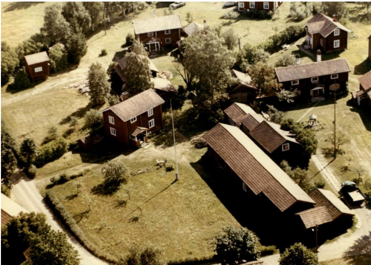
Flygfoto över gamla ursprungliga Estersgården, som är gården längs upp till vänster.