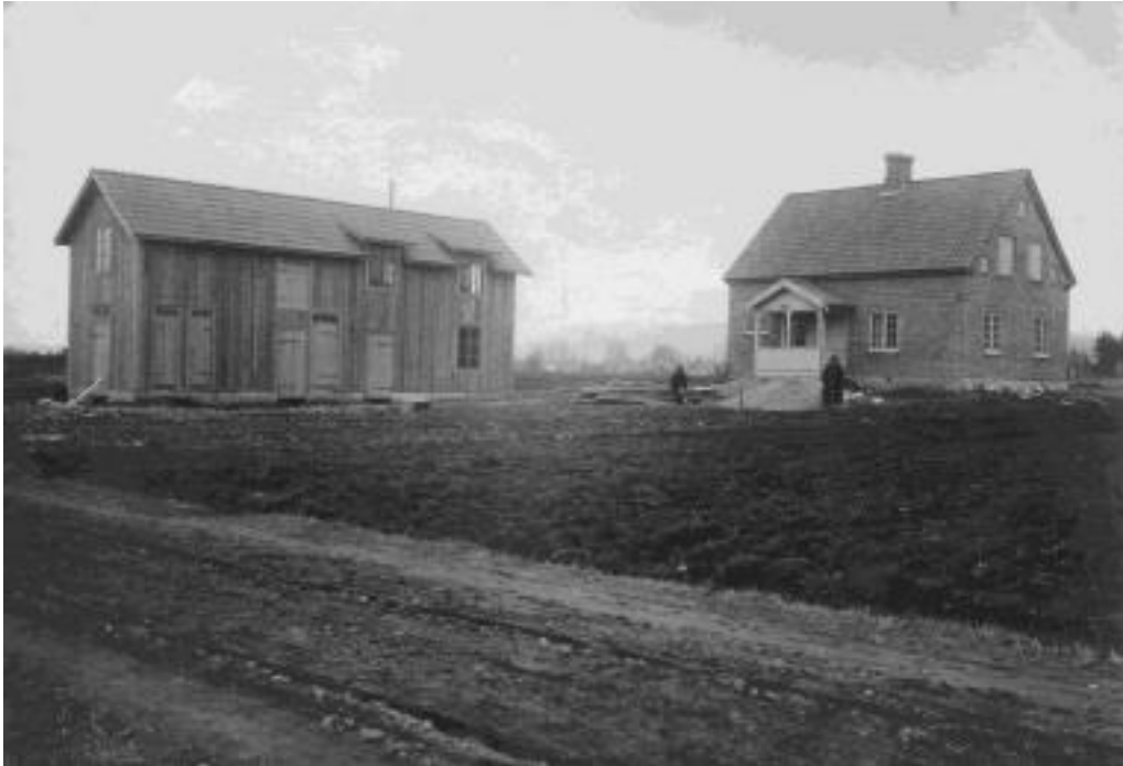
Så här såg farmor och farfars gård ut när den var alldeles nybyggd 1923. Runtomkring bredde åkrarna ut sig.